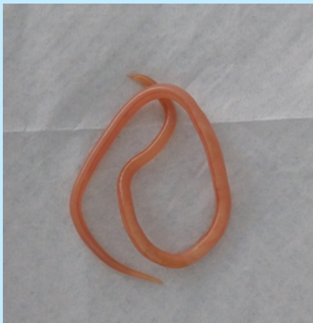
Parásito de familia Ascarididae